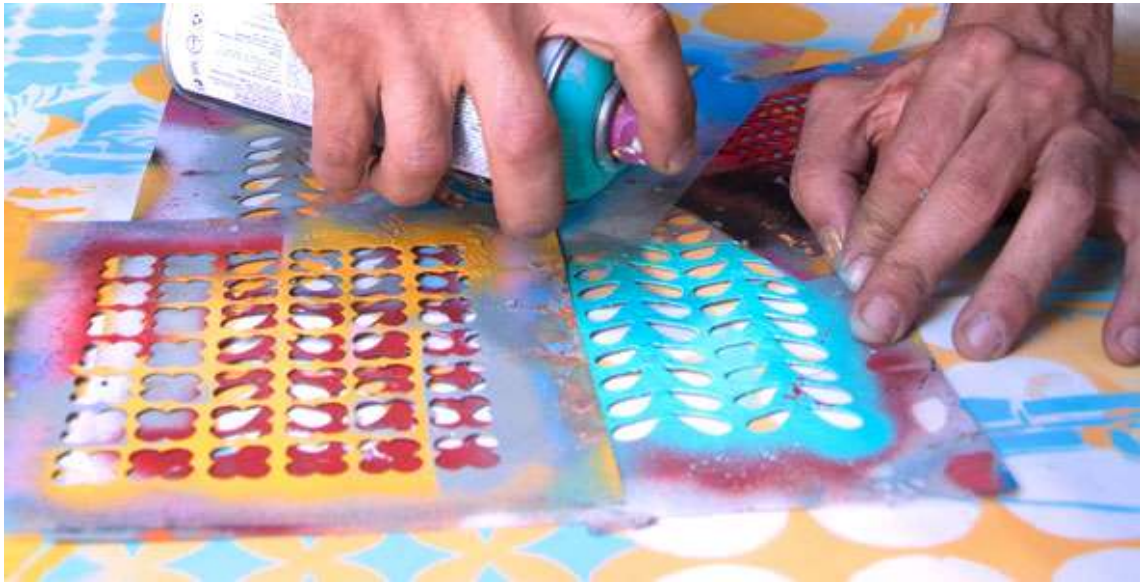
Imagen 12 (Cabaio)